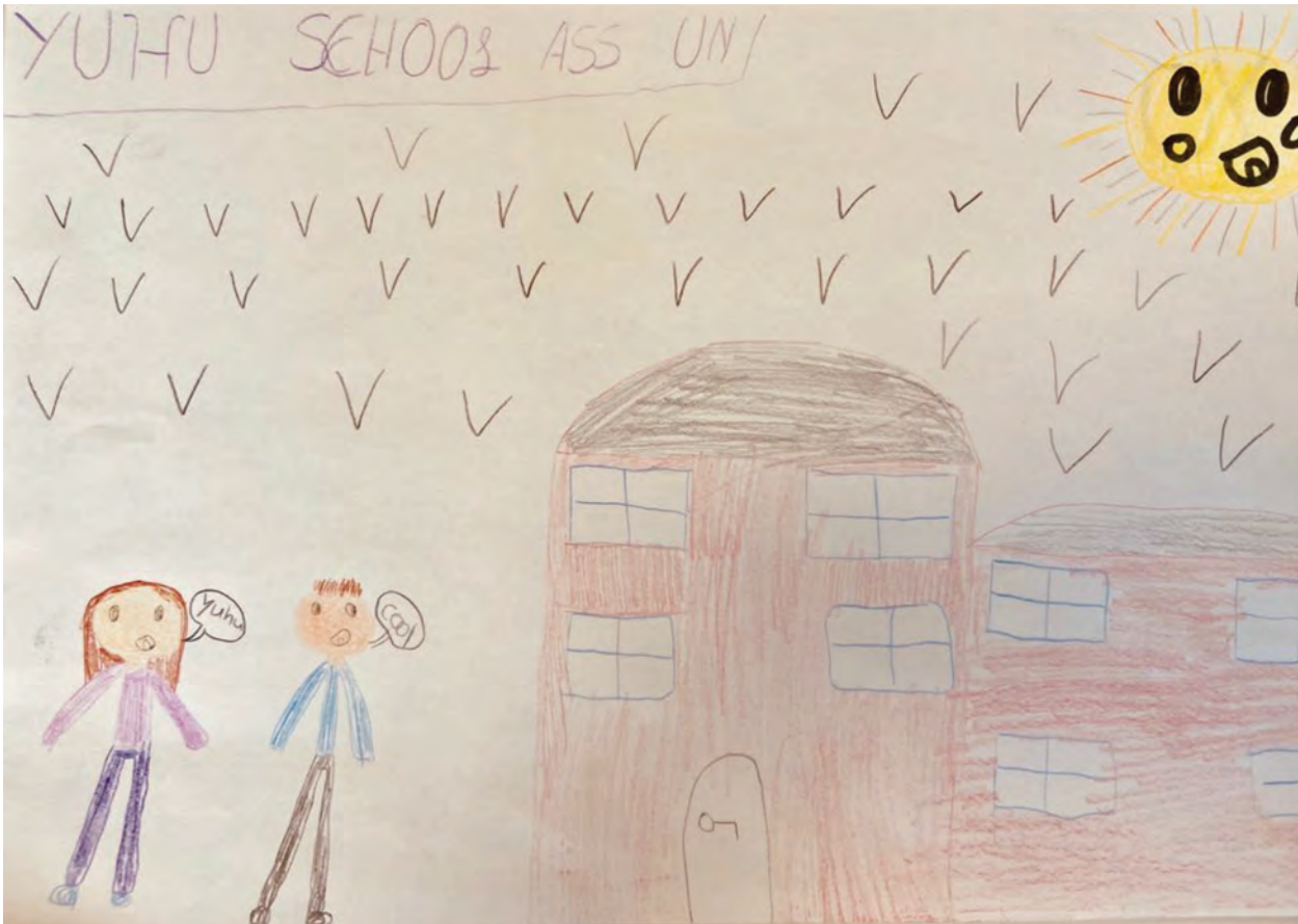
Chloé, cycle 3.1