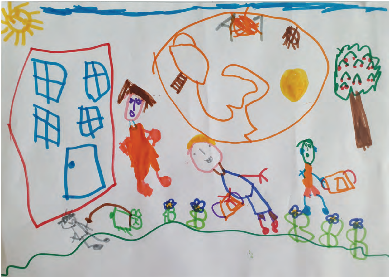
Noemie, cycle 1