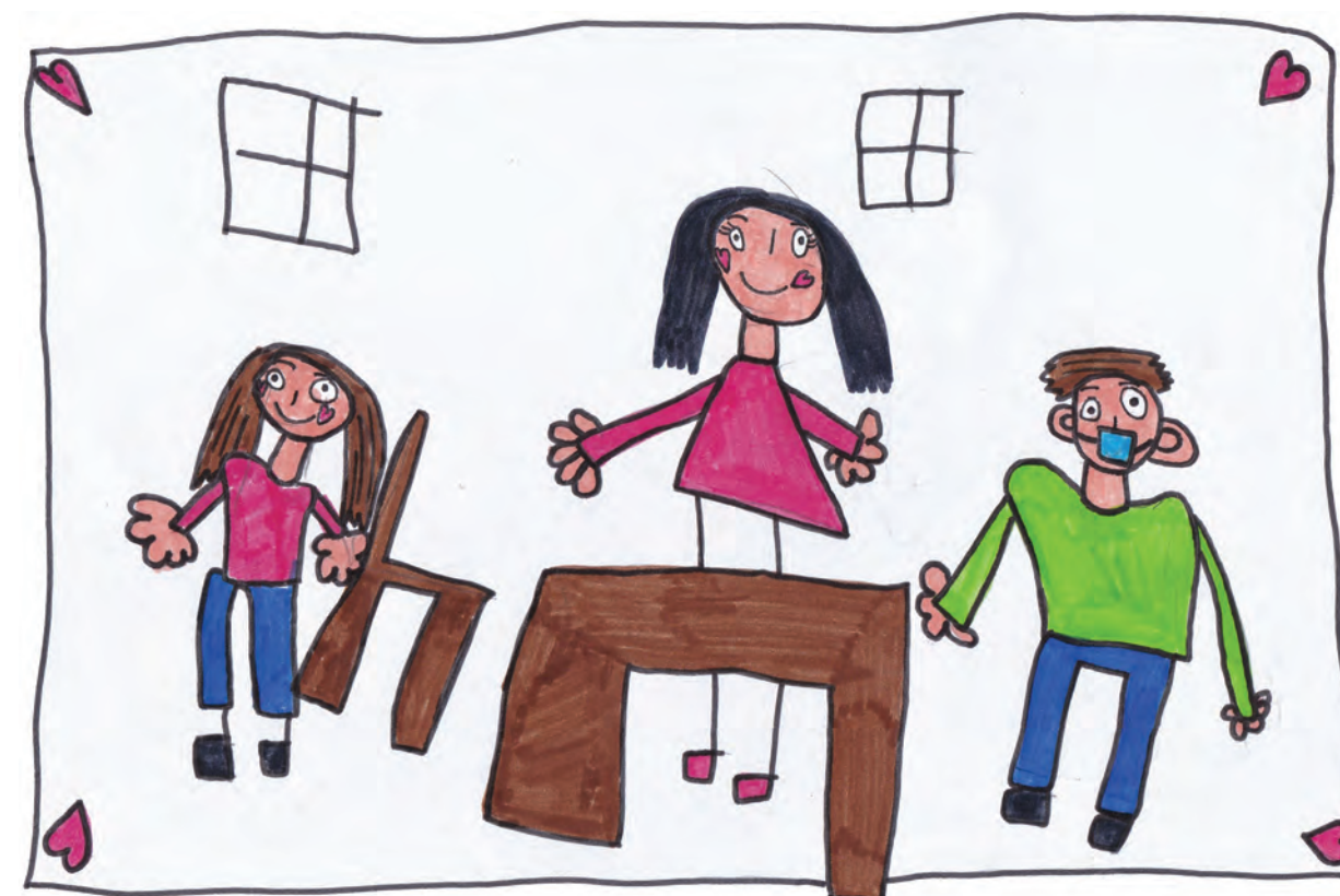
Emma, cycle 1